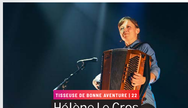
TISSEUSE DE BONNE AVENTURE | 22

Vendredi 14 mars 2025 20h30 | Salle du FCC | Cossé-le-Vivien