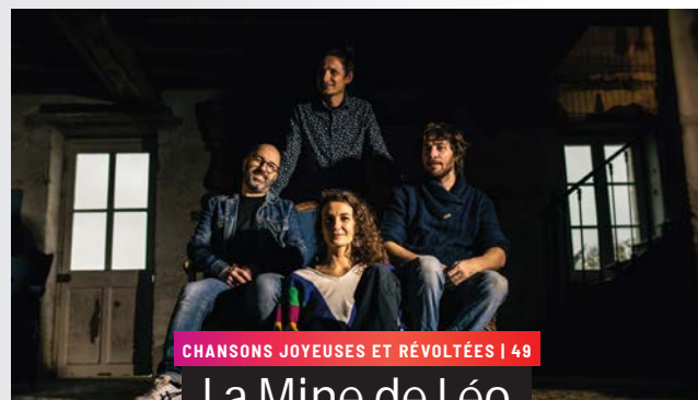
CHANSONS JOYEUSES ET RÉVOLTÉES | 49

Samedi 15 mars 2025 20h30 | Salle du FCC | Cossé-le-Vivien