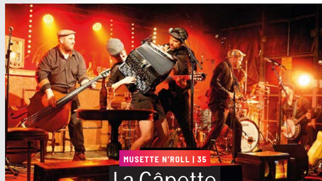
MUSETTE N'ROLL | 35