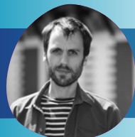
Krocui (35) Graphiste, auteur-illustrateur livre et presse jeunesse