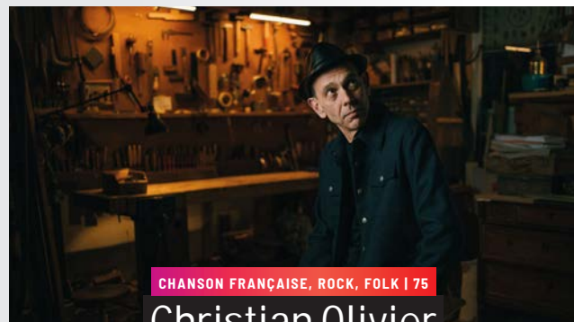
CHANSON FRANÇAISE, ROCK, FOLK | 75

ENTRACTE SERVI PAR L'AMICALE LAÏQUE - CRÊPES/CIDRE