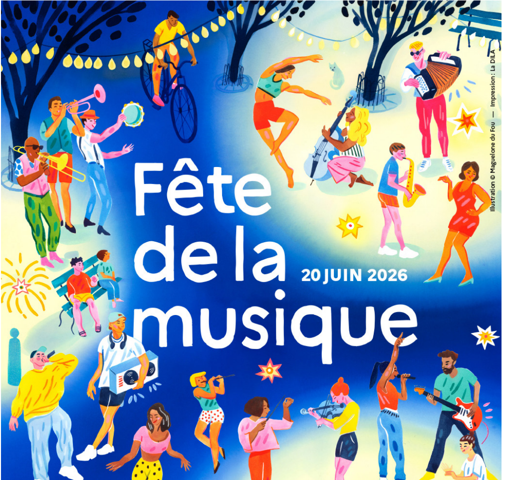
Illustration : Magulone du Fou — Impression : La DILA