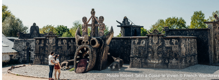
Musée Robert Tatin à Cossé-le-Vivien