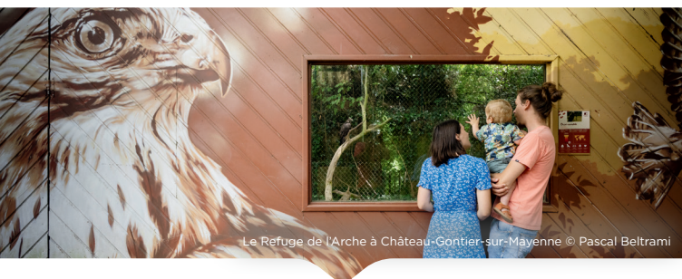
Le Refuge de l'Arche à Château-Gontier-sur-Mayenne