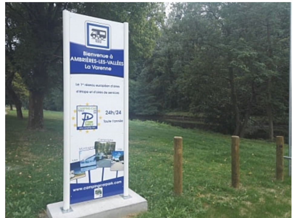
Bocage Mayennais Tourisme

16 emplacements dans un cadre de verdure au bord de la Varenne À 10 km de Mayenne et Lassay-les-Châteaux, Petite Cité de Caractère Aire située à 900 m des commerces et du bourg d'Ambrières-les-Vallées À proximité de nombreux sentiers de randonnée et de la Vélo Francette Borne de services et zone de vidange Toilettes à proximité. Forfait 5h + services : 5